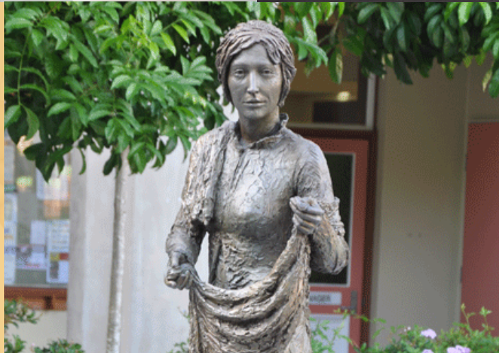
Escultura de Catherine McAuley en All Hallows' School, Brisbane ~ Escultora: Meliesa Judge

‘La frase más frecuente en los Evangelios es “Jesús se conmovió o se llenó de compasión”’