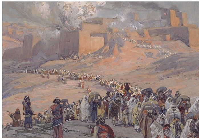
James Tissot, El vuelo de los prisioneros

Al estar inmerso en la experiencia de la era Covid-19, las imágenes que me vinieron a la mente cuando quise poner esa experiencia en diálogo con la tradición bíblica relacionada con el exilio babilónico. En el siglo VI a.C., los babilonios conquistaron el sur del reino de Judá, con su capital Jerusalén. El rey de Judá, junto con muchos de los miembros de la élite y educados de Judá, incluidos los sacerdotes (Ezequiel, por ejemplo), fue llevado al exilio en Babilonia. Aproximadamente diez años más tarde, en respuesta a una rebelión, los babilonios saquearon e incendiaron el templo de Jerusalén que se había construido en la época de Salomón, más de trescientos años antes. Otro grupo de personas fue exiliado en Babilonia en esa etapa, dejando "a algunos de los más pobres de la tierra como viñadores y labradores de la tierra", según 2 Reyes 25:12.