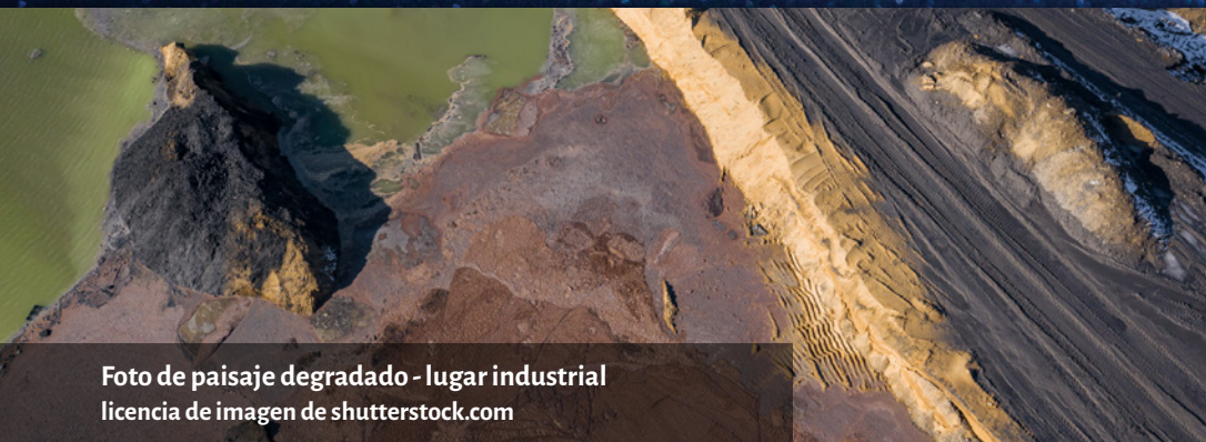
Foto de paisaje degradado - lugar industrial

‘La degradación de la Tierra condujo a una emergencia de tres capas visible en el cambio climático mundial, acercándose a los puntos de inflexión de los ecosistemas (Amazonas, Ártico, Australia y Antártico), y a la amenaza sin precedentes de la pérdida de biodiversidad y la destrucción del hábitat.