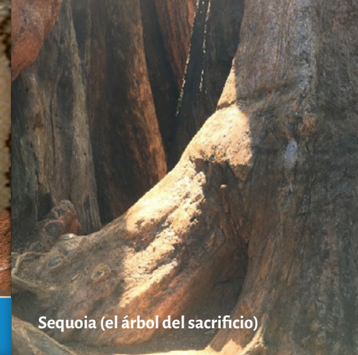
Sequoia (el árbol del sacrificio)

‘Si tuviéramos que crear una nube de palabras para describir la contemplación, incluiría las palabras ver, ojos, corazón, quietud, silencio, presencia, escuchar, apertura.’