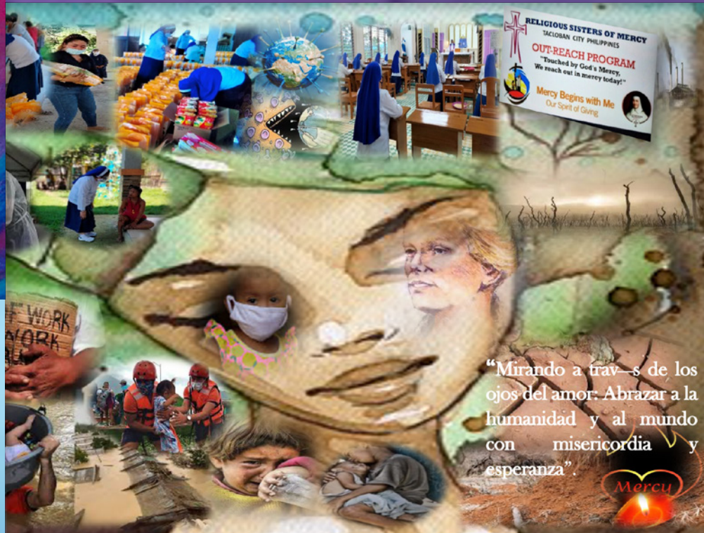
‘Mirando a través de los ojos del amor: Abrazar con misericordia y esperanza’, by Ma. Victoria Pederanga

‘Es un don ver más allá del primer nivel de la vista, ver más allá de las apariencias en el corazón de lo que se percibe. La visión contemplativa hace eso. Nos lleva más allá de la superficie hacia el significado. Nos lleva al momento revelador de la vista. Es la experiencia de la sacramentalidad viva.’