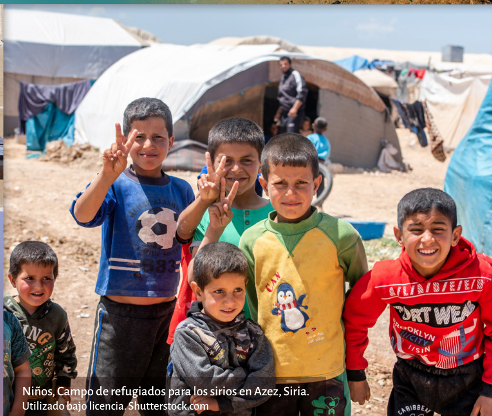
Niños, Campo de refugiados para los sirios en Azez, Siria.

capítulo 6: Tengo esperanzas de que nazca una nueva historia con la prevención, la protección y el enjuiciamiento como eje central y con júbilo gritaré ¡YA NO ESTOY EN VENTA! el cuerpo contiene la historia