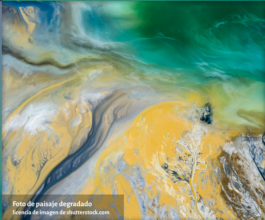
Foto de paisaje degradado