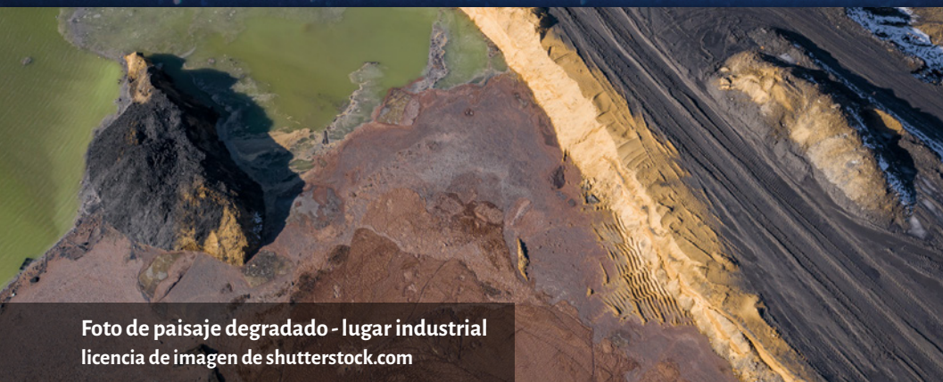
Foto de paisaje degradado - lugar industrial

‘Si la desfiguración de los pobres es una desfiguración de Dios, de la misma manera una desfiguración de la Tierra es una desfiguración de Dios... De ahora en adelante, el cuidado del medio ambiente debe ser entendido como el núcleo de lo que la misericordia es, de lo que la misericordia nos pide hacer.’