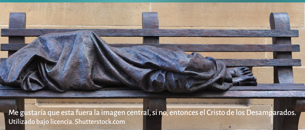
Me gustaría que esta fuera la imagen central, si no, entonces el Cristo de los Desamparados.

‘Entre las numerosas personas desplazadas dentro y fuera de nuestros países hay refugiados, solicitantes de asilo, desplazados internos, personas sin hogar o alojadas en condiciones precarias, personas con deficiencias cognitivas, víctimas de la trata de personas, personas sometidas a la violencia doméstica y ancianos en centros de atención a largo plazo.’