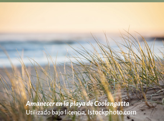
Amanecer en la playa de Coolangatta

Se dijeron: “¿No ardían nuestros corazones dentro de nosotros mientras nos hablaba en el camino, mientras nos abría las escrituras?”