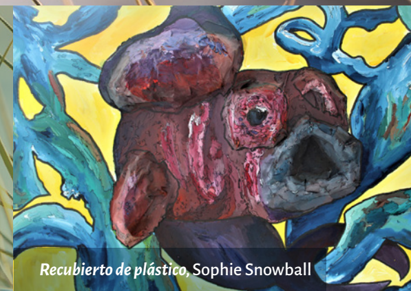
Recubierto de plástico