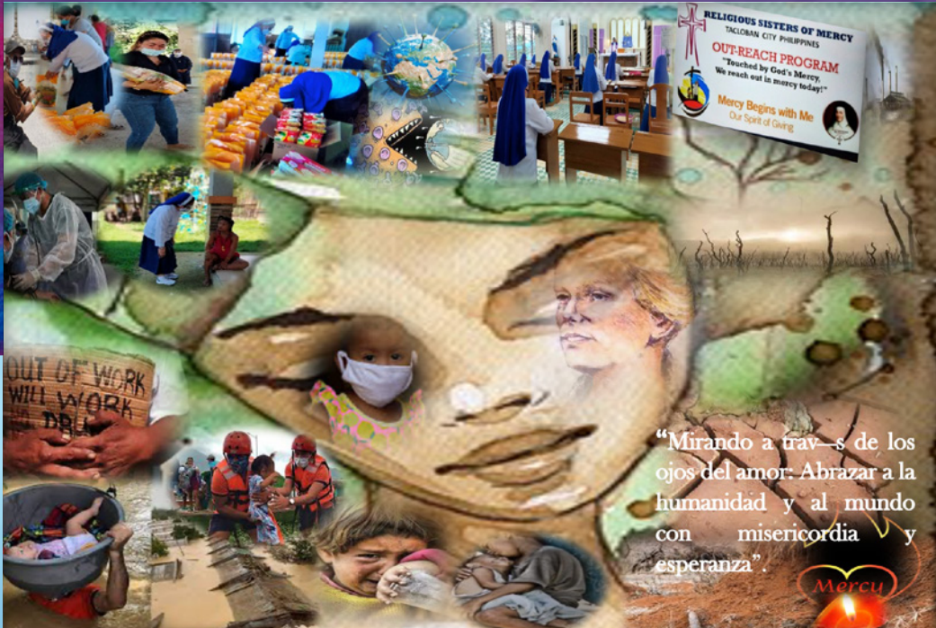
‘Mirando a través de los ojos del amor: Abrazar con misericordia y esperanza’, by Ma. Victoria Pederanga

‘Es un don ver más allá del primer nivel de la vista, ver más allá de las apariencias en el corazón de lo que se percibe. La visión contemplativa hace eso. Nos lleva más allá de la superficie hacia el significado. Nos lleva al momento revelador de la vista. Es la experiencia de la sacramentalidad viva.’