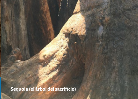
Sequoia (el árbol del sacrificio)

‘Si tuviéramos que crear una nube de palabras para describir la contemplación, incluiría las palabras ver, ojos, corazón, quietud, silencio, presencia, escuchar, apertura.’