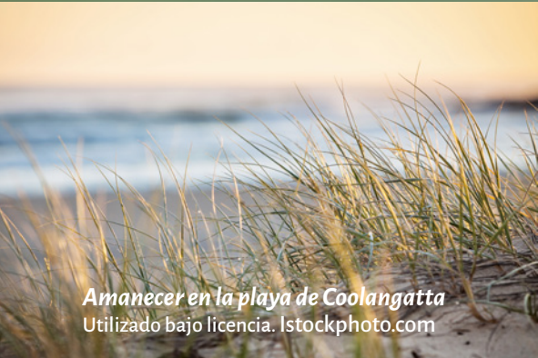
Amanecer en la playa de Coolangatta

Se dijeron: “¿No ardían nuestros corazones dentro de nosotros mientras nos hablaba en el camino, mientras nos abría las escrituras?”