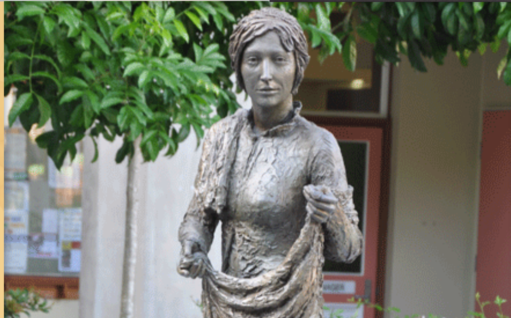
Escultura de Catherine McAuley en All Hallows' School, Brisbane ~ Escultora: Meliesa Judge

‘La frase más frecuente en los Evangelios es “Jesús se conmovió o se llenó de compasión”.’