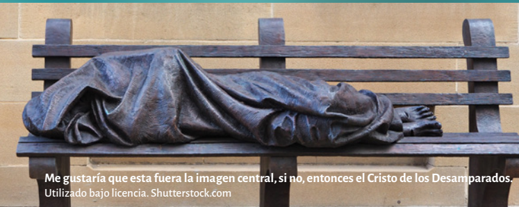
Me gustaría que esta fuera la imagen central, si no, entonces el Cristo de los Desamparados.

‘Entre las numerosas personas desplazadas dentro y fuera de nuestros países hay refugiados, solicitantes de asilo, desplazados internos, personas sin hogar o alojadas en condiciones precarias, personas con deficiencias cognitivas, víctimas de la trata de personas, personas sometidas a la violencia doméstica y ancianos en centros de atención a largo plazo.’