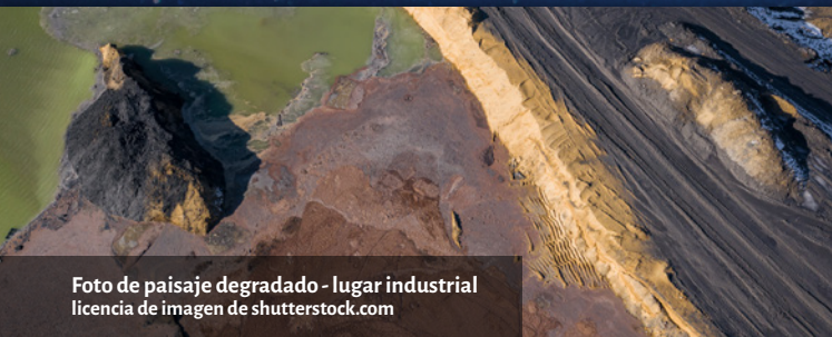
Foto de paisaje degradado - lugar industrial

‘Si la desfiguración de los pobres es una desfiguración de Dios, de la misma manera una desfiguración de la Tierra es una desfiguración de Dios... De ahora en adelante, el cuidado del medio ambiente debe ser entendido como el núcleo de lo que la misericordia es, de lo que la misericordia nos pide hacer.’