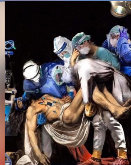
Este es el “Viernes Santo 2020” (Vyacheslav Okun sj)