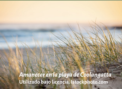
Amanecer en la playa de Coolangatta

Se dijeron: “¿No ardían nuestros corazones dentro de nosotros mientras nos hablaba en el camino, mientras nos abría las escrituras?”