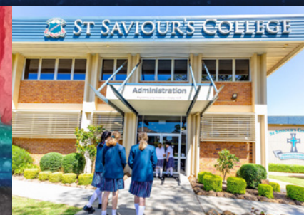
Colegio San Salvador, Toowoomba, Queensland, Australia

‘San Salvador es una comunidad muy diversa que claramente tiene la fe, las tradiciones y la misericordia en el corazón. La naturaleza inclusiva de la escuela asegura que se proporcione una experiencia de fe vivida, y que cada estudiante sea valorado por la contribución única que hace.’