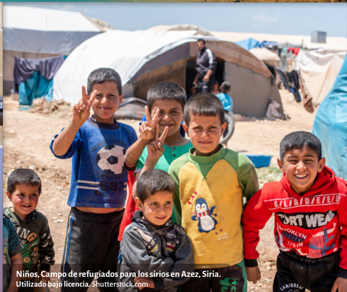
Niños, Campo de refugiados para los sirios en Azez, Siria.

‘En medio de esta dramática situación de COVID-19, que ha “desplazado” tanto en nuestras vidas y en nuestro mundo, podemos tener dificultades para ver, sentir y oír los efectos de esta resurrección. Este contexto nos recuerda algo que ya sabemos y que con demasiada frecuencia olvidamos: que es el crucificado el que ha resucitado. La palabra de Dios viene a ayudar a nuestra frágil memoria.’