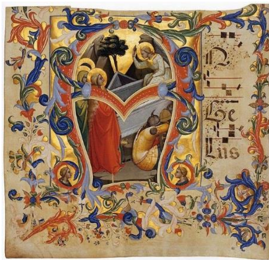
Las Tres Marías en la Tumba de Lorenzo Monaco (1396).

La imagen final de 'ir a lo profundo' en el Evangelio de Lucas ocurre en el 24:1 cuando las mujeres van a la tumba. El primer día de la semana, al amanecer ( orthrou batheōs ), llegaron a la tumba, llevando las especias que habían preparado. En el texto griego original, ( orthrou batheōs ), las mujeres literalmente llegan a la tumba al atardecer profundo de la mañana. Las mujeres se encuentran 'yendo a las profundidades', y el resultado es que vienen a ver con nuevos ojos. Recibiendo el mensaje de que Jesús ha resucitado (24:5), van y cuentan la noticia a los otros discípulos (24:8). Una vez más, el viaje hacia "lo profundo" es una oportunidad para la expansión de la conciencia. Lamentablemente, la proclamación de las mujeres no se cree (24:11).