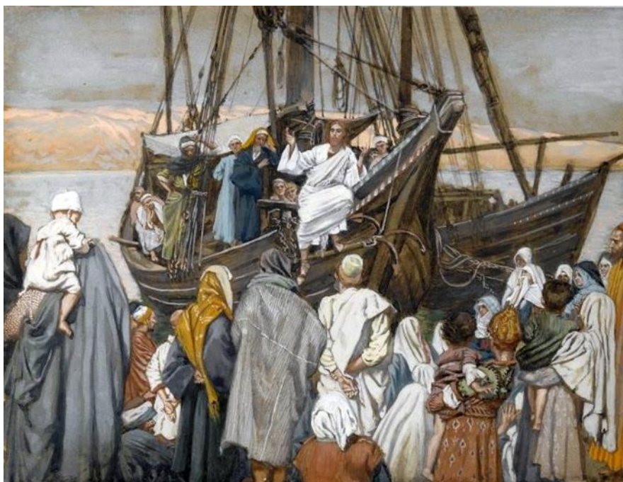
James Tissot, Jesús predica en un barco . Siglo XIX. Dominio Público.

Una vez que Jesús estaba de pie junto al lago de Genesaret, y la multitud le apretaba para oír la palabra de Dios, vio dos barcas a la orilla del lago; los pescadores habían salido de allí y estaban lavando sus redes. Se subió a una de las barcas, la de Simón, y le pidió que se alejara un poco de la orilla. Luego se sentó y enseñó a la multitud desde el barco. Cuando terminó de hablar, le dijo a Simón: " Métete en el agua profunda y deja caer tus redes para pescar". Respondió Simón: "Maestro, hemos trabajado toda la noche, pero no hemos pescado nada. Pero si tú lo dices, bajaré las redes". Cuando lo hicieron, pescaron tantos peces que sus redes estaban empezando a romperse.