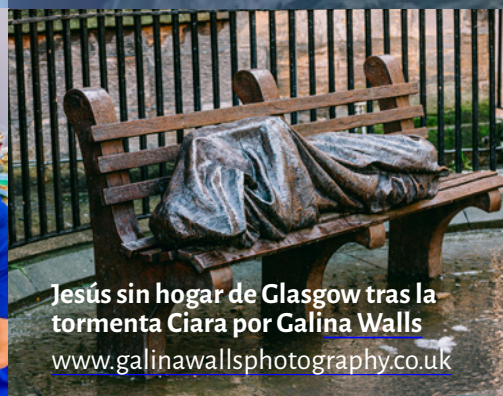
Jesús sin hogar de Glasgow tras la tormenta Ciara