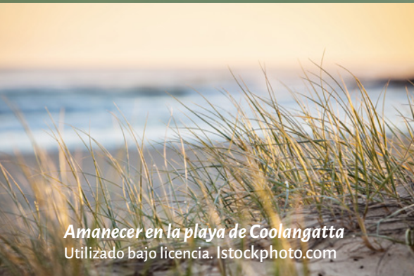
Amanecer en la playa de Coolangatta

Se dijeron: “¿No ardían nuestros corazones dentro de nosotros mientras nos hablaba en el camino, mientras nos abría las escrituras?”