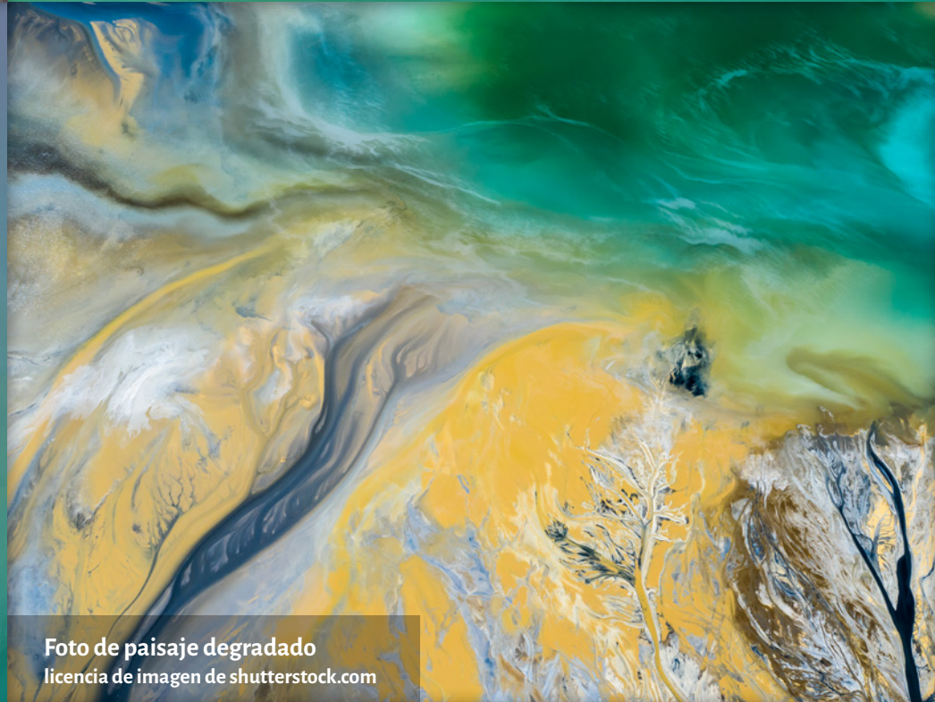
Foto de paisaje degradado

‘A través de estos dos aspectos de la Misericordia viviente, el “práctico-activo” y el “reflexivo-espiritual”, podemos dar una respuesta comprometida e integrada para sanar la degradación de la Tierra y sus criaturas y, al hacerlo, curar nuestra comunidad humana.’