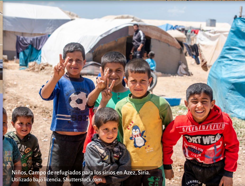
Niños, Campo de refugiados para los sirios en Azez, Siria. Utilizado bajo licencia. Shutterstock.com

‘En medio de esta dramática situación de COVID-19, que ha “desplazado” tanto en nuestras vidas y en nuestro mundo, podemos tener dificultades para ver, sentir y oír los efectos de esta resurrección. Este contexto nos recuerda algo que ya sabemos y que con demasiada frecuencia olvidamos: que es el crucificado el que ha resucitado. La palabra de Dios viene a ayudar a nuestra frágil memoria.’