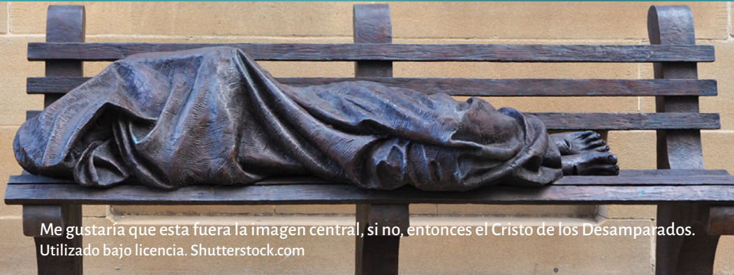
Me gustaría que esta fuera la imagen central, si no, entonces el Cristo de los Desamparados.

‘Entre las numerosas personas desplazadas dentro y fuera de nuestros países hay refugiados, solicitantes de asilo, desplazados internos, personas sin hogar o alojadas en condiciones precarias, personas con deficiencias cognitivas, víctimas de la trata de personas, personas sometidas a la violencia doméstica y ancianos en centros de atención a largo plazo.’